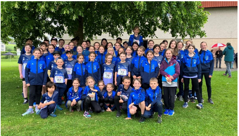
Bild: LA Kerns am UBS Kids Cup in Alpnach